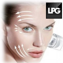
ENDERMOLOGIE® GESICHT UND KÖRPER