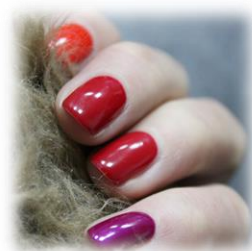
NAGEL- UND HANDPFLEGE